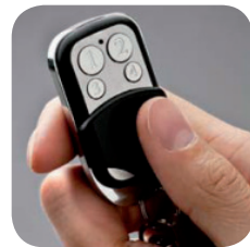
滑蓋式標準無線遙控器 鍍鎳表面能保護控制器