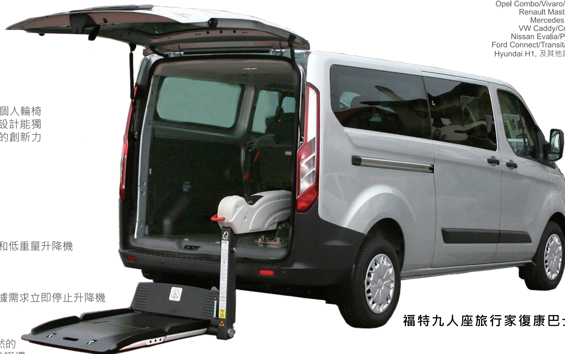
福特九人座旅行家復康巴士

Fiorella升降機的半自動版本, 『LCD控制器』可依空間需求, 安裝於車輛內部的適當位置, 並滿足護理人員或駕駛員操控之需求。此外, Fiorella 提供左或右臂的配置及伸展型尺寸的平台, 能優化升降機以適合各種安裝程序和位置。